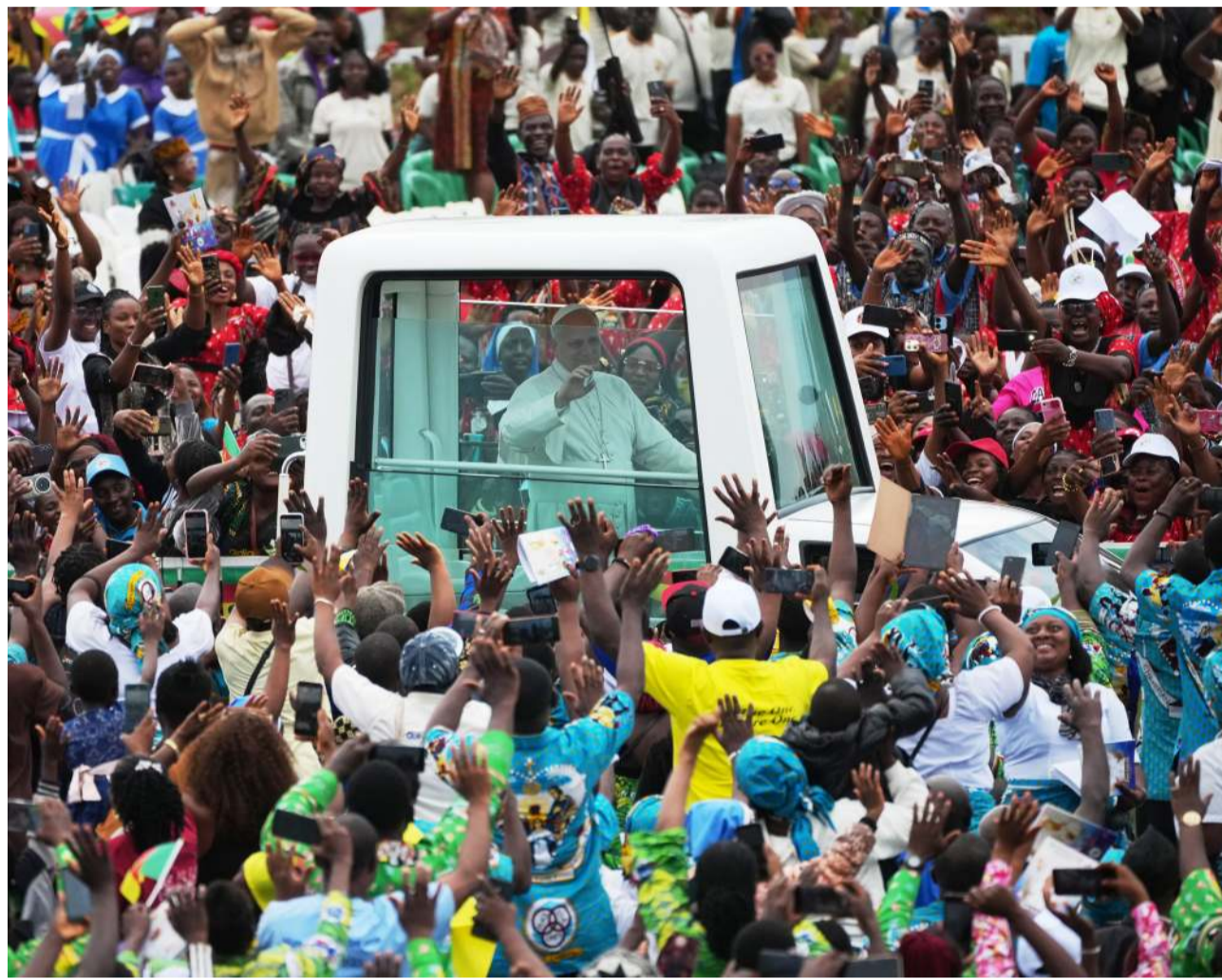
Accueilli dans une ambiance survoltée à Yaoundé, Léon XIV a béni les milliers de fidèles massés le long des routes de l'aéroport qui l'ont acclamé.

«La sécurité est une priorité, mais elle doit toujours s'exercer dans le respect des droits humains», a lancé le souverain pontife en soulignant le rôle de la société civile, dont les ONG humanitaires et les syndicats, dans la «paix sociale».