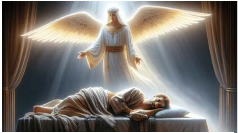
Figure 7: Le songe de Joseph

Marie avait été accordée en mariage à Joseph et avant qu'ils aient habité ensemble, elle fut enceinte. Joseph décida de la renvoyer en secret. Or, voici que l'ange du Seigneur lui apparut en songe et lui dit : « Joseph, fils de David, ne crains pas de prendre chez toi Marie, ton épouse, puisque l'enfant qui est engendré en elle vient de l'Esprit Saint. (Mt 1,18-20)