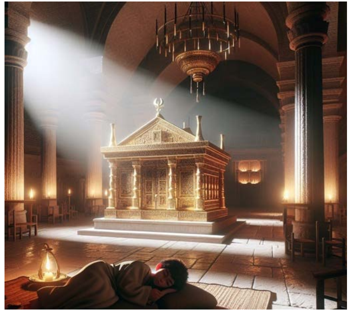
Figure 4: Samuel dort dans le Temple, https://bible.art/p/iEPI2XBUZjVioyCqiH5P