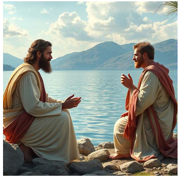
Figure 10: Jésus et Pierre sur les bords du lac de Tibériade, https://deepai.org

Quand ils eurent mangé, Jésus dit à Simon-Pierre : « Simon, fils de Jean, m'aimes-tu vraiment, plus que ceux-ci ? » Il lui répond : « Oui, Seigneur ! Toi, tu le sais : je t'aime. » Jésus lui dit : « Sois le berger de mes agneaux. » Il lui dit une deuxième fois : « Simon, fils de Jean, m'aimes-tu vraiment ? » Il lui répond : « Oui, Seigneur ! Toi, tu le sais : je t'aime. » Jésus lui dit : « Sois le pasteur de mes brebis. » Il lui dit, pour la troisième fois : « Simon, fils de Jean, m'aimes-tu ? » Pierre fut peiné parce que, la troisième fois, Jésus lui demandait : « M'aimes-tu ? » Il lui répond : « Seigneur, toi, tu sais tout : tu sais bien que je t'aime. » Jésus lui dit : « Sois le berger de mes brebis. » Pierre, voyant donc le disciple aimé, dit à Jésus : « Et lui, Seigneur, que lui arrivera-t-il ? » Jésus lui répond : « Si je veux qu'il demeure jusqu'à ce que je vienne, que t'importe ? Toi, suis-moi. » (Jn 21,15-17.21-22)