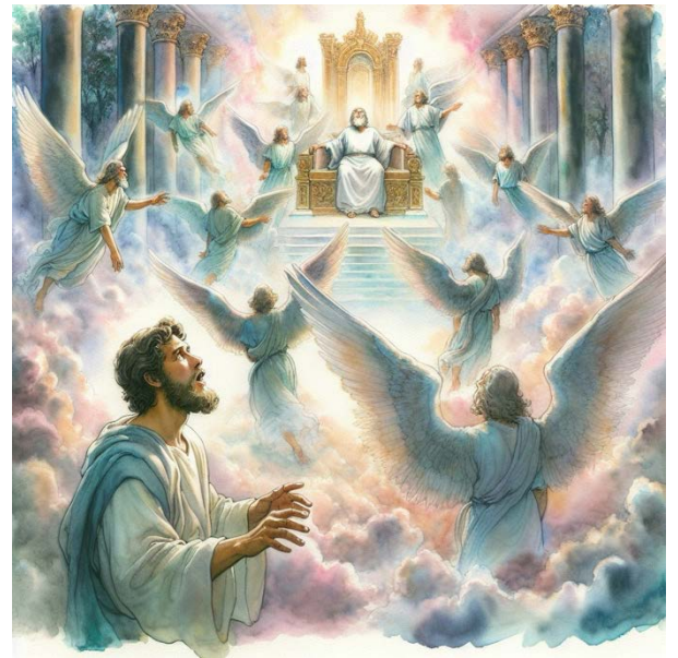
Figure 6: La vocation d'Isaïe, https://images.app.goo.gl/WLBgobJhjrqrHhwa6

L'année de la mort du roi Ozias, je vis le Seigneur qui siégeait sur un trône très élevé. Je dis alors : « Malheur à moi ! je suis perdu, car je suis un homme aux lèvres impures, j'habite au milieu d'un peuple aux lèvres impures : et mes yeux ont vu le Roi, le Seigneur de l'univers ! » L'un des séraphins vola vers moi, tenant un charbon brûlant. Il l'approcha de ma bouche et dit : « Ceci a touché tes lèvres, et maintenant ta faute est enlevée, ton péché est pardonné. » J'entendis alors la voix du Seigneur qui disait : « Qui enverrai-je ? qui sera notre messager ? » Et j'ai répondu : « Me voici : envoie-moi ! » (Is 6,1.5-8)