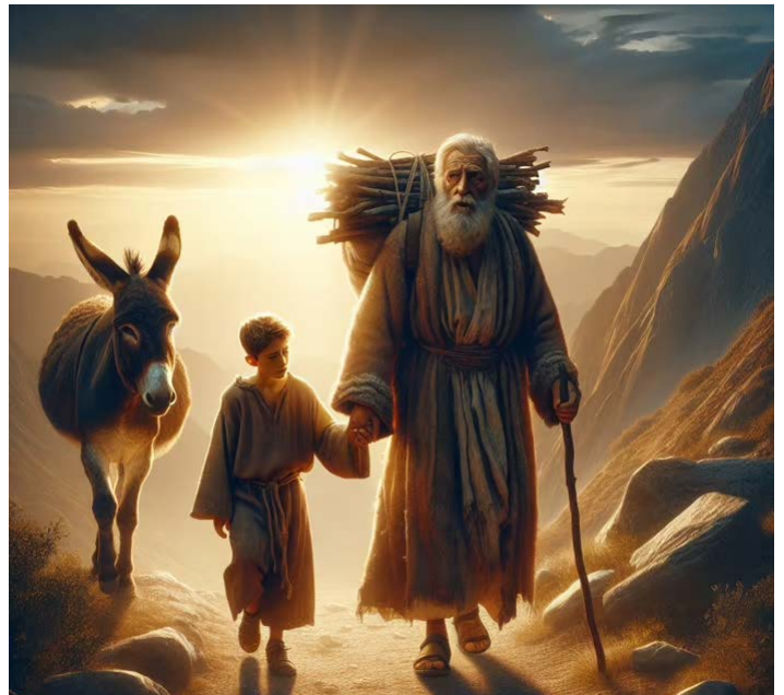
Figure 2: Abraham et Isaac, https://easy-peasy.ai/ai-image-generator/images/aged-man-teen-son-ascend-mountain-donkey-symbolic-journey

Abraham est appelé par Dieu à une grande mission : il sera à l'origine d'un peuple qui deviendra le peuple de Dieu. Or, pour réaliser cette mission, il doit accepter de s'aventurer dans l'inconnu en abandonnant tout ce qu'il pense posséder. Il doit partir de sa patrie, quitter sa famille et doit laisser derrière lui son héritage.