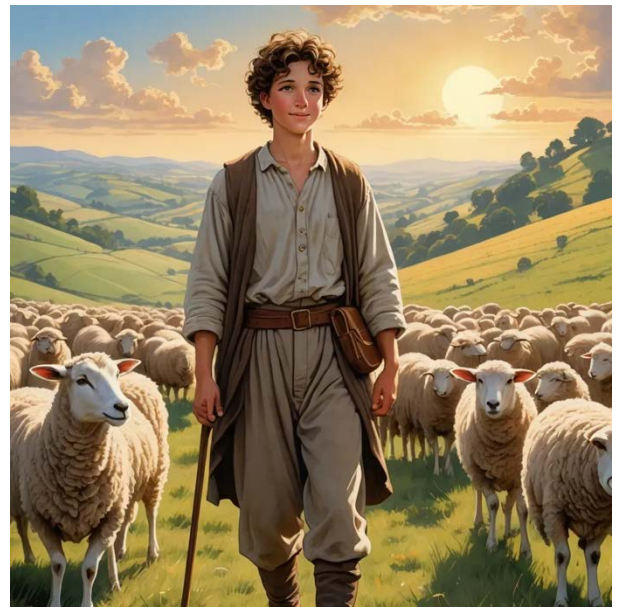
Figure 5: David faisant paître le troupeau