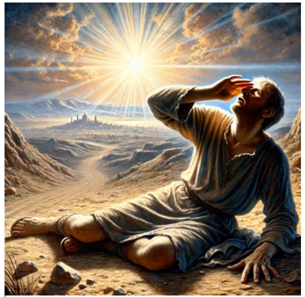
Figure 9: La conversion de Paul, https://ki-andacht.de/333-vom-dunkel-ins-licht-die-geschichte-von-saulus-bekehrung/

Comme Paul était en route et approchait de Damas, soudain une lumière venant du ciel l'enveloppa de sa clarté. Il fut précipité à terre ; il entendit une voix qui lui disait : « Saul, Saul, pourquoi me persécuter ? » Il demanda : « Qui es-tu, Seigneur ? » La voix répondit : « Je suis Jésus, celui que tu persécutes. Relève-toi et entre dans la ville : on te dira ce que tu dois faire. » Saul se releva de terre et, bien qu'il eût les yeux ouverts, il ne voyait rien. Ses compagnons le prirent par la main pour le faire entrer à Damas. [...] il fut baptisé [...] et, sans plus attendre, il proclamait Jésus dans les synagogues, affirmant que celui-ci est le Fils de Dieu. (Ac 9,3-8.18-20)