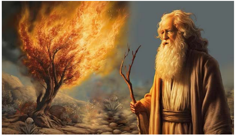
Figure 3: Moïse, https://www.freepik.com/premium-ai-image/moses-burning-bush-ai-generated-illustration_40469343.htm

Moïse dit alors à Josué : « Choisis des hommes, et va combattre les Amalécites. Moi, demain, je me tiendrai sur le sommet de la colline, le bâton de Dieu à la main. » Josué fit ce que Moïse avait dit. [...] Quand Moïse tenait la main levée, Israël était le plus fort. Quand il la laissait retomber, Amalec était le plus fort. (Ex 17,9-11)